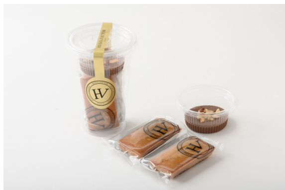
Financier chocolat with chocolat and nut spread (フィナンシェ ショコラナッツスプレッド付き) 926円(税別)

パリの有名情報誌「FIGARO SCOPE」にてパリで最も美味しいフィナンシェに選ばれたこともある自慢のフィナンシェを今年は新しいスタイルで登場。特製のショコラナッツスプレッドにつけてお召し上がりいただきます。