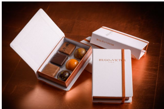
Blanc Classique(ブラン クラシック) 6個入 2,800円 / 12個入 4,800円 / 24個入 8,500円(税別) HUGO & VICTORの代名詞ともいえる黒色のカルネと対照的な真っ白のカルネが登場。