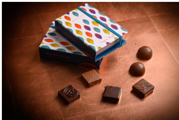
Coeur de fève(クールド フェーブ) 2,800円(税別)

パリ・日本共通サロン・デュ・ショコラ限定アソート&日本限定ショコラナッツスプレッド付きフィナンシェ 日本最大級のショコラの祭典「サロン・デュ・ショコラ」において2つの限定商品を出品いたします。